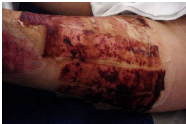
Figura 1 - Área doadora tratada por rayon em exposição.

A alta do paciente foi diretamente relacionada ao tempo de restauração da área doadora, após a qual o paciente recebia alta hospitalar. A área doadora de enxerto de pele de espessura parcial foi considerada completamente restaurada quando a gaze tipo rayon estava totalmente despreendida do leito da ferida nos grupos tratados com esse curativo.