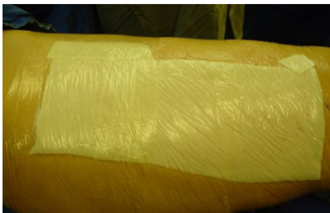
Figura 2 - Área doadora tratada por curativo de colágeno com alginato coberto com filme de poliuretano transparente.